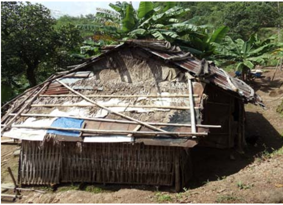
H.9 & H.10 'Khách Sạn Ngàn Sao'