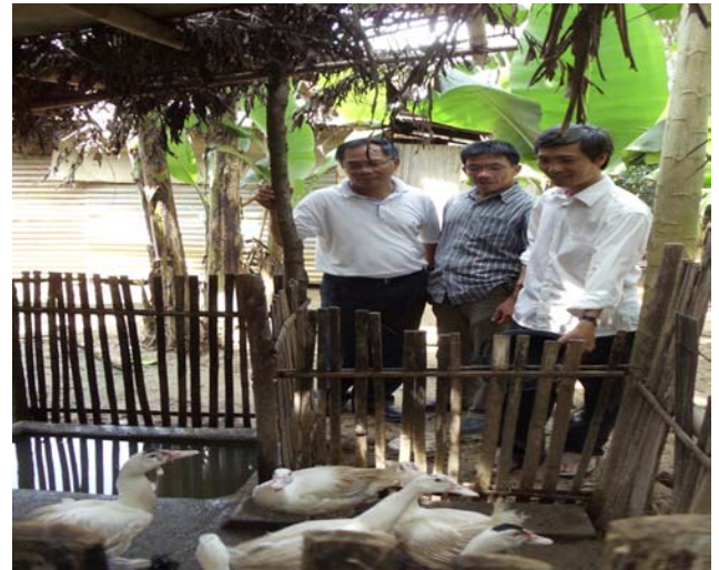
H.16 Phụ quần áo cho con là trông nhờ bấy ngan.