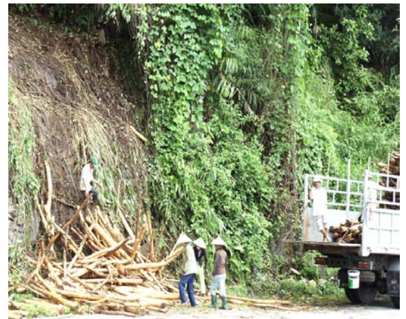
H.1 Nạn phá rừng: chuyển gỗ bằng xe