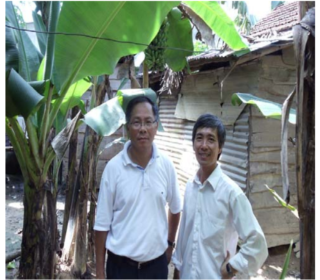
H.15 Phụ sách vở cho trẻ em là bụi chuối sau nhà.