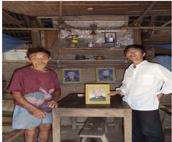
H.11 Chỗ tốt nhất dành cho bàn thờ