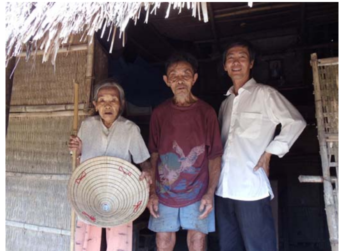
H.13 'Con ra đời có mẹ cha...'

Ngoài những rẻo đất bạc thang càng ngày càng cằn cỗi, mùa mưa trồng lúa ruộng, mùa hè trồng lúa rẫy... nhưng quanh năm suốt tháng cứ mất mùa hoài... có mùa chỉ đủ nuôi chim. Cho nên trăm sự của dân làng đều trông nhờ vào thời tiết