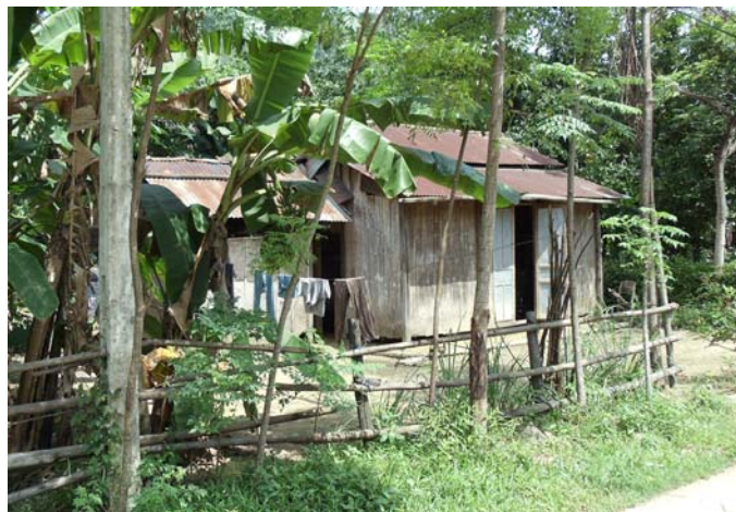
H.7 & H.8 Những 'Túp Lều Lý Tưởng'