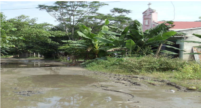
H4. Lòng đường trở thành ao nước lớn.