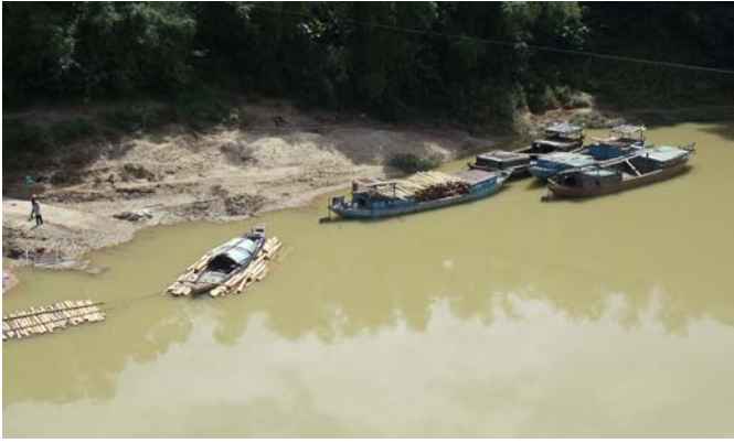
H.2 Nạn phá rừng: chuyển gỗ bằng ghe, bằng bè...