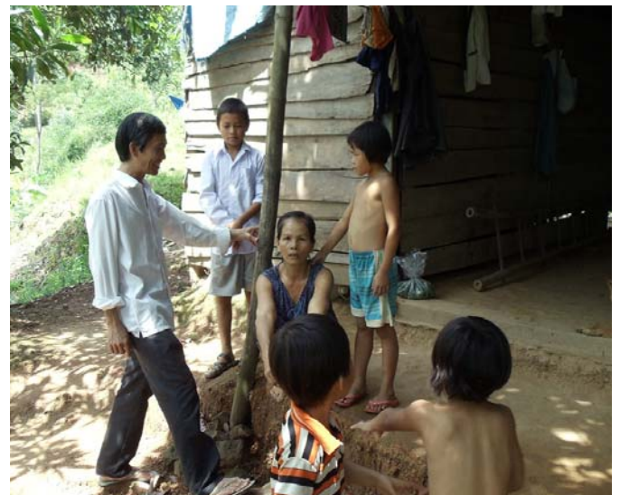
H.14 Ai cũng có gia đình... Ai cũng có con cháu... mà sao con mắt nó cứ cay cay...