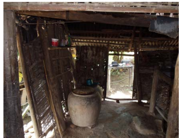
H.12 Chỗ kém nhất có lẽ dành cho nhà bếp.

Vào bên trong nhà, chúng tôi mới thấy hết được sự nghèo nàn của họ. Không chỗ nào mà không bị dột. Có lẽ chỗ tốt nhất dành cho bàn thờ còn chỗ kém nhất thì dành cho nhà bếp chăng? Giường chiếu tủ bàn rất thô sơ được đặt trên nền đất nện cứng thô ráp. Trong nhà chẳng có gì đáng vào xu nên cũng chẳng cần cửa, có chăng là một tấm phen tre để chắn gió che mưa. (Xem hình H 11 và H 12)