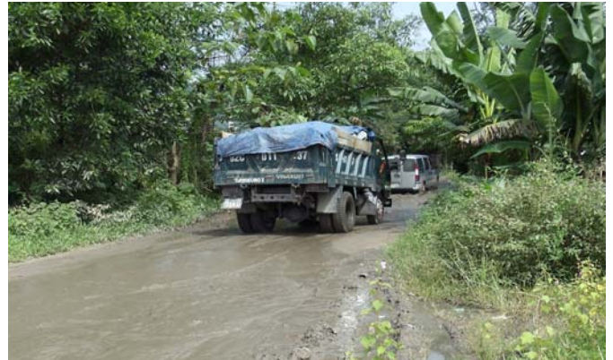
H.3 Đường làng biến thành đường sông