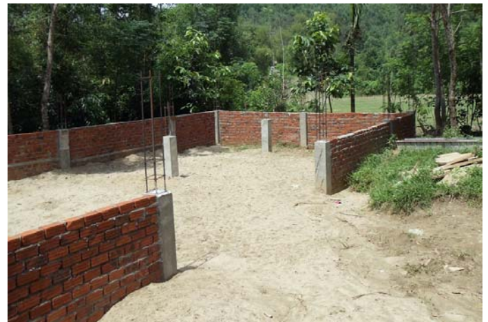
H.17 & H.18 Chúng con cần một chỗ 'All-in-One': cầu nguyện, hội họp, cưới xin, vĩnh biệt và tránh thiên tai bão lụt.