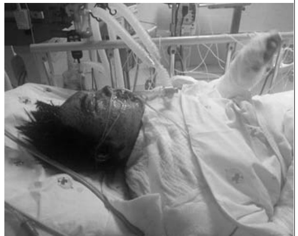
Vẫn còn hy vọng!!!