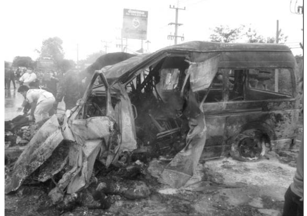
Hiện trường xảy ra tai nạn 2/6/2014

Sau đây là một số hình ảnh của tai nạn. Xin đừng xem nếu chúng làm cho Quý Vị sợ hãi và thêm đau lòng.