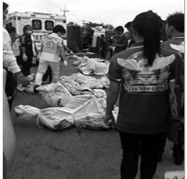
Các bạn trẻ đến hiện trường để nhận xác anh chị em của mình.