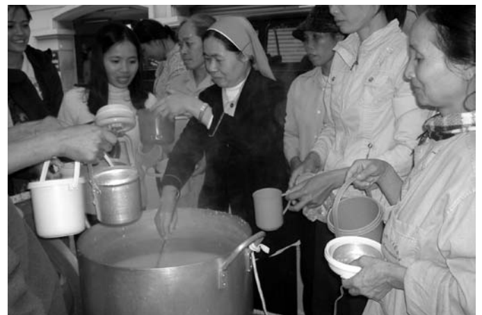
Từ từ ai cũng có phần thôi. Soeur sẽ xin Chúa làm phép lạ qua Quý Ân Nhân cho anh chị em.