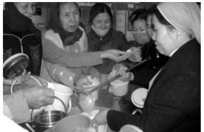
Soeur ơi cho già này thêm chút nữa đi Soeur.