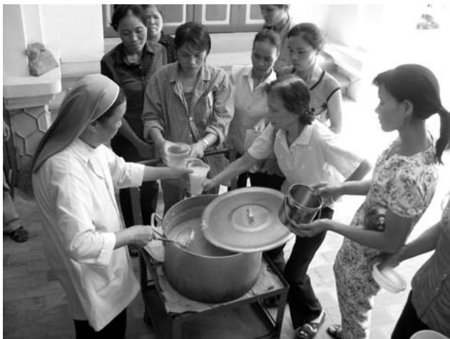
Cà-mèn của con sao to thế?